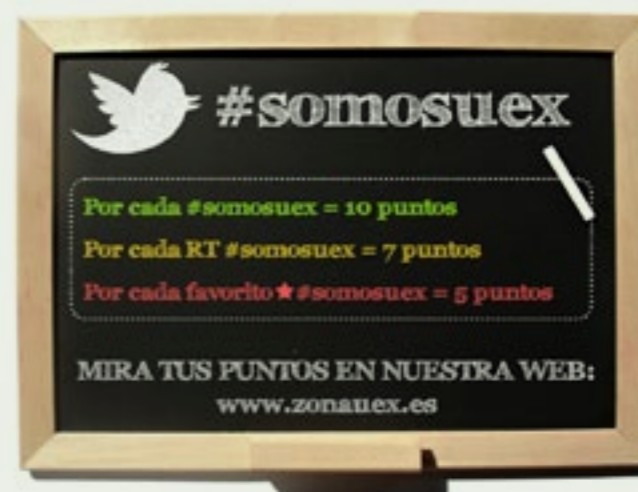
Tablas de puntos

La Tienda de la UEx, bautizada como “Zona UEx. Tu Tienda Universitaria”, está considerada como un servicio a la toda la comunidad universitaria, así como una herramienta de “promoción y difusión de la imagen de marca de la Universidad de Extremadura”. Los servicios de la Tienda de la Universidad de Extremadura abarcan desde la venta de productos de la marca Universidad de Extremadura, hasta placas conmemorativas, abriendo un abanico de posibilidades para suplir las necesidades que desde cualquier servicio, secretariado o desde el propio alumnado puedan surgir.